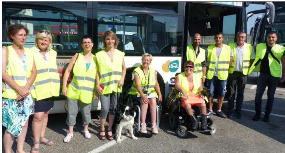
Une équipe tout sourire pour une mise en situation réelle et des échanges fructueux.

L'association des paralysés de France (APF) a développé depuis un an un nouveau dispositif de formation, intitulé "APF Conseil". L'ensemble des formations sont dispensées par des formateurs eux-mêmes en situation de handicap. Début 2017, une convention a été signée avec le STAC (service de transport de l'agglomération chambérienne) pour former l'ensemble des conducteurs de bus et certains agents. Après onze sessions de quatre heures, les conducteurs sont très satisfaits de ces rencontres conviviales avec des personnes-ressources. Après une heure d'activité sous forme de photo expression, deux heures de mises en situation sont proposées avec un vrai